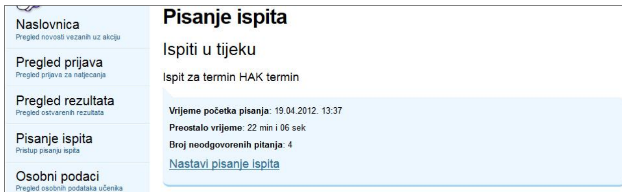
Slika 4. Nastavak pisanja ispita u tijeku

Ako se, iz bilo kojeg razloga, dogodi da učenik ugasi ispit, dovoljno je da opet dođe na podstranica " Pisanje ispita " gdje će mu biti ponuđen nastavak pisanja ispita.