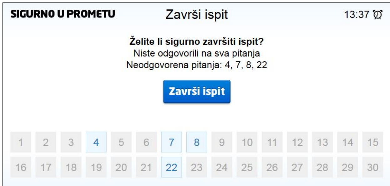
Slika 6. Završetak pisanja ispita

Nakon klika se pojavljuje zaslon za završetak pisanja ispita.