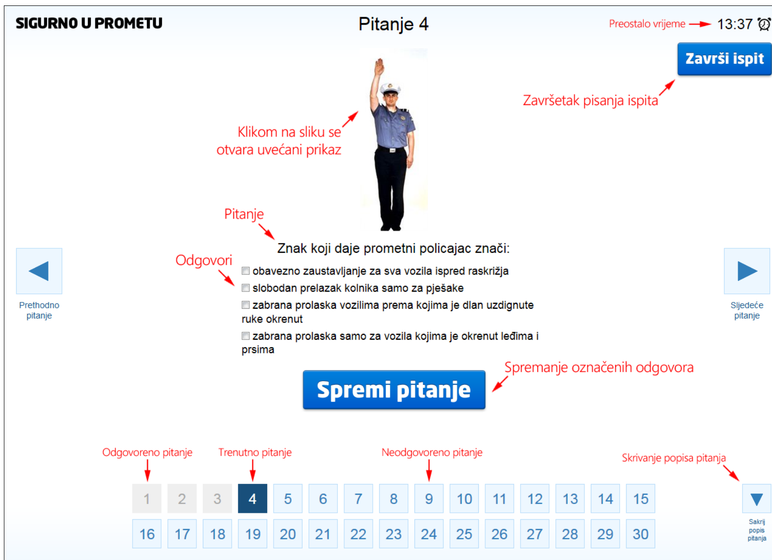
Slika 5. Ispitno sučelje